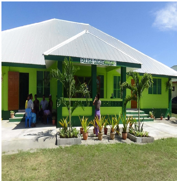
MAOTA PULEGA GAGA'EMAUGA I MALUA

Ua fai i lagi le tuligasi'a a le Aiga Sa Tagaloa Ina ua a'e malo le faiva, ua malo tau malie toa Sa tautiga mo Iesu, a o alo faiva i tiute ma tofi Lenei ua mapu ane teisi, ina ua pule mai le oti Sa outou faatuatua, na onosai ma le faamaoni Ua outou selesele le tau, e ulufale ma le olioli Amuia outou ua muamua, ua mapu foi mai tiga Ua aga atu i le nuu moni, e le toe i ai se pogisa O loo faatali mai le Alii o Iesu sa outou tautua Na te faafeiloai, e faa'ula ma faapale tou soifua E tofia outou e pule i lona malo faatasi ma Ia Le malo e mamalu o le Tamai Mamoe na fasia. Faatasi ma isi uso ua outou saofaga faatasi ai Na o pesega ma viiga, o faaneetaga le mea e fai Tou te vaai i fofoga o Iesu i aso uma e le aunoa E faalogo i Lona siufofoga alofa pe a Ia saunoa Ia malie afenoa pe afai tou te le toe mafuta lelei Ma e sa pele i loto ma agaga i le olaga i lalo nei Ona o aiaiga o le Malo o le Lagi ua uma pasia E le toe fai ava pe nofo tane, ae o agelu filifilia Siomia le nofoa o le Tama le Alo & Agaga Paia. E.Sulu