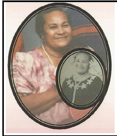
Apele Tipamaa Falasii Pasi