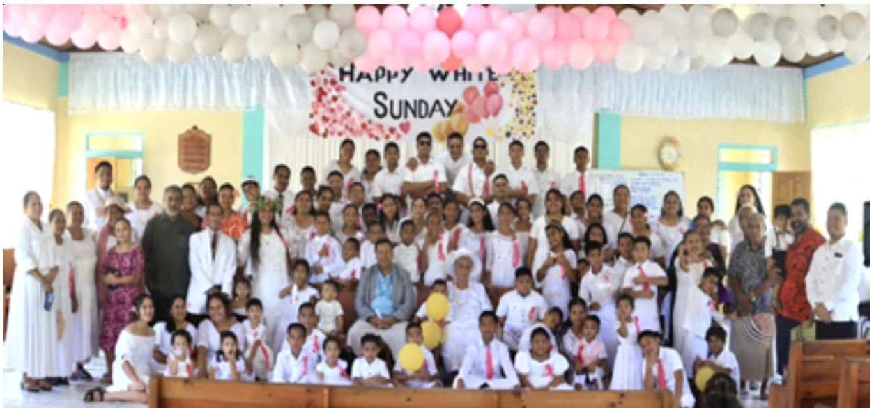
EFKS Loimata o Apaula i le Lotu Tamaiti Iona 125, Aso Sa 8 Oketopa 2023