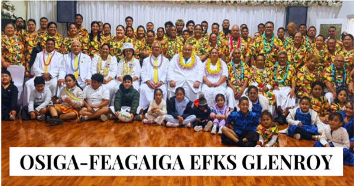
OSIGA-FEAGAIGA EFKS GLENROY

email: sulusamoa@cccs.org.ws -Main Office: Ph. 24414, Ext 29 - website: www.cccs.org.ws