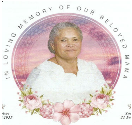
ORISKA ALIITASI FILIPO SAMANIA